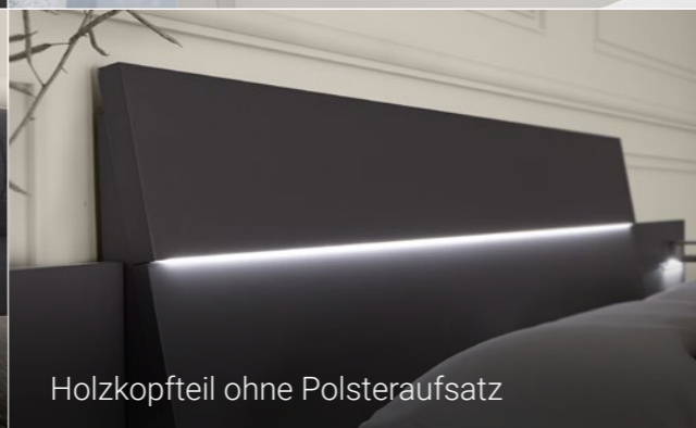
Holzkopfteil ohne Polsteraufsatz