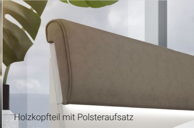
Holzkopfteil mit Polsteraufsatz