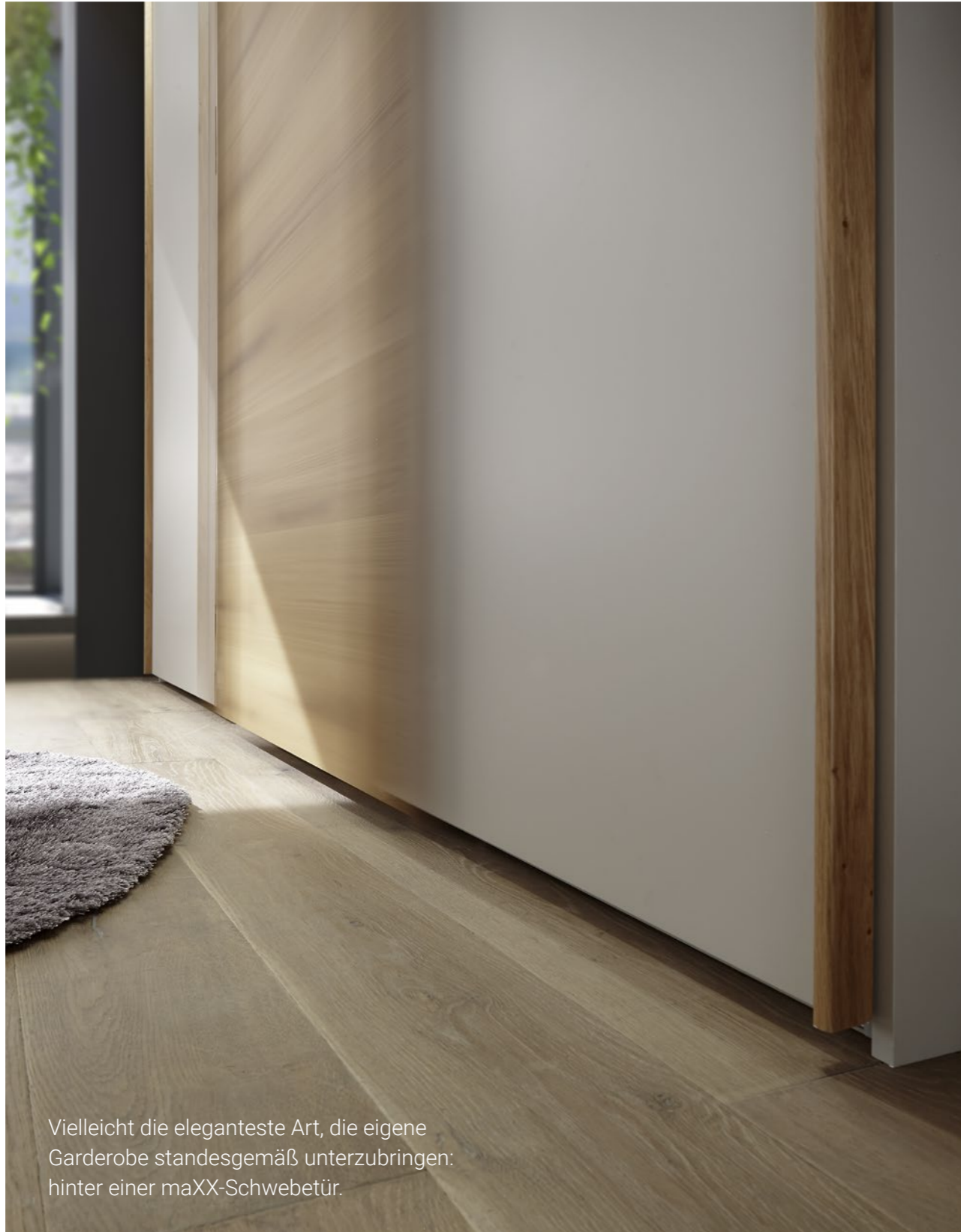
Vielleicht die eleganteste Art, die eigene Garderobe standesgemäß unterzubringen: hinter einer maXX-Schwebetür.